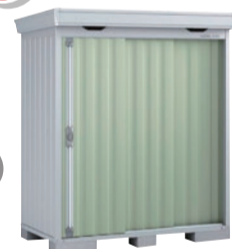
イナバ物置FS 1809S 物件に設置いたします ※ご成約時に色をお選びいただけます