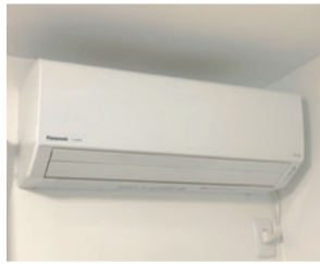
Panasonic Jシリーズ 物件に設置いたします